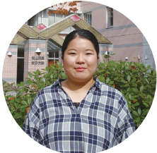
松山東雲女子大学 人文科学部 心理子ども学科 心理福祉専攻 (4年)