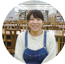
松山東雲女子大学 人文科学部 心理子ども学科 心理福祉専攻 (2年)

シャドウイングとインタビューで私が学んだことは、仕事上の対人関係を上手く築くためには、相手を思いやる行動が大切だということと、仕事と子育てを両立することで、家庭の外からの情報が入ってきたり、家族以外の意見を聞くことができるということです。将来、自分が子育てをすることになっても仕事を続けたいと思っています。その時は、自分が可能な範囲で両立できるようにしたいです。